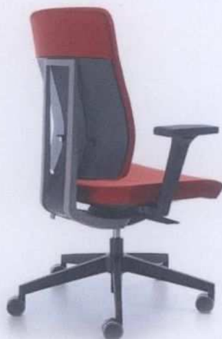
Fot. 1. Krzesło pracownicze XENON 10STL P59PU.