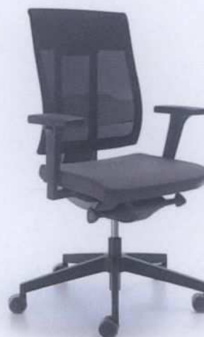
Fot. 2. Krzesło pracownicze XENON NET 101SFL P59PU.

Krzesła pracownicze serii XENON/XENON NET to krzesła na amortyzatorze gazowym z oparciem połączonym z siedziskiem przy wykorzystaniu synchronizmów, które w połączeniu z możliwością regulacji wysokości siedziska i oparcia oraz kąta nachylenia oparcia, a także odpowiednimi profilami siedziska i oparcia zapewniają możliwość dostosowania warunków siedzenia do anatomicznych potrzeb użytkowników. Zastosowane mechanizmy umożliwiają siedzenie dynamiczne i przyjmowanie zrelaksowanej, odchylonej do tyłu pozycji ciała.