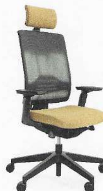
Fot. 2. Krzesło pracownicze Xenon Net 11SFL P70TPU.

Krzesła pracownicze serii XENON/XENON NET to krzesła na amortyzatorach gazowych z oparciami połączonymi z siedziskami przy wykorzystaniu mechanizmów typu SYNCHRO, które w połączeniu z możliwością regulacji wysokości siedziska i oparcia oraz kąta nachylenia oparcia, a także odpowiednimi profilami siedziska i oparcia zapewniają możliwość dostosowania warunków siedzenia do anatomicznych potrzeb użytkowników. Zastosowane mechanizmy umożliwiają siedzenie dynamiczne i przyjmowanie zrelaksowanej, odchylonej do tyłu pozycji ciała.