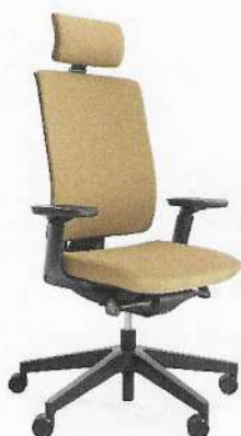
Fot. 1. Krzesło pracownicze Xenon 11SFL P70TPU.