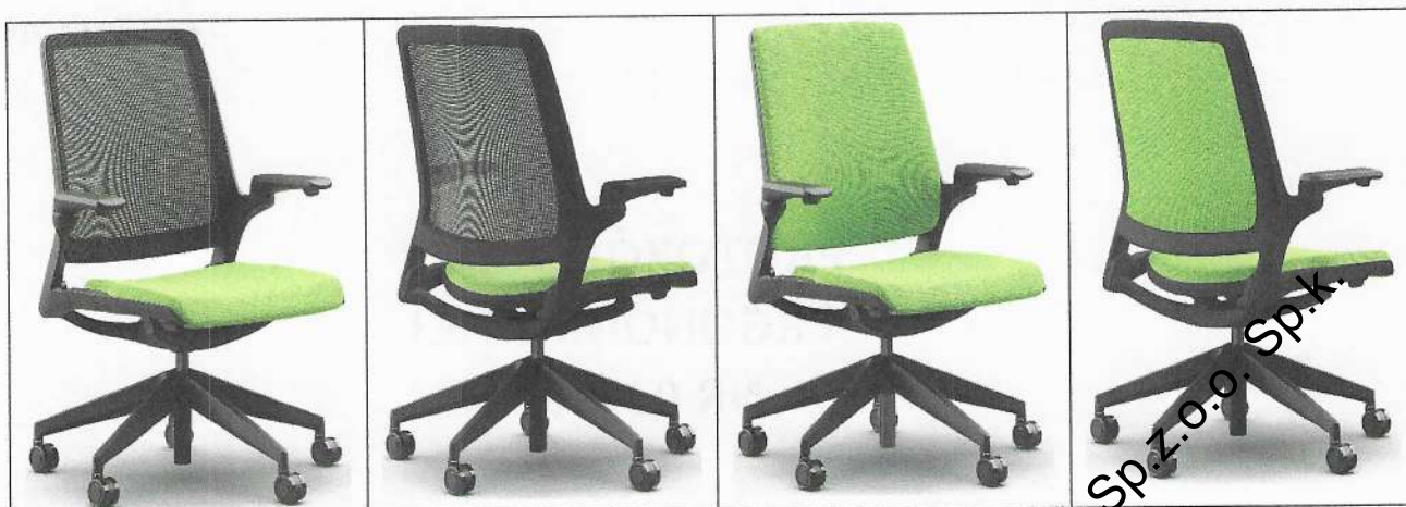
Fot. 1. Krzesło obrotowe SMART w wersji siatkowej i tapicerowanej

Krzesła obrotowe serii SMART to krzesła na amortyzatorze gazowym z oparciem połączonym z siedziskiem przy wykorzystaniu mechanizmu tilt, który w połączeniu z możliwością regulacji wysokości siedziska oraz kąta nachylenia oparcia, a także odpowiednimi profilami siedziska i oparcia zapewnia możliwość dostosowania warunków siedzenia do anatomicznych potrzeb użytkowników. Zastosowany mechanizm umożliwia siedzenie dynamiczne i przyjmowanie zrelaksowanej, odchyłonej do tyłu pozycji ciała.